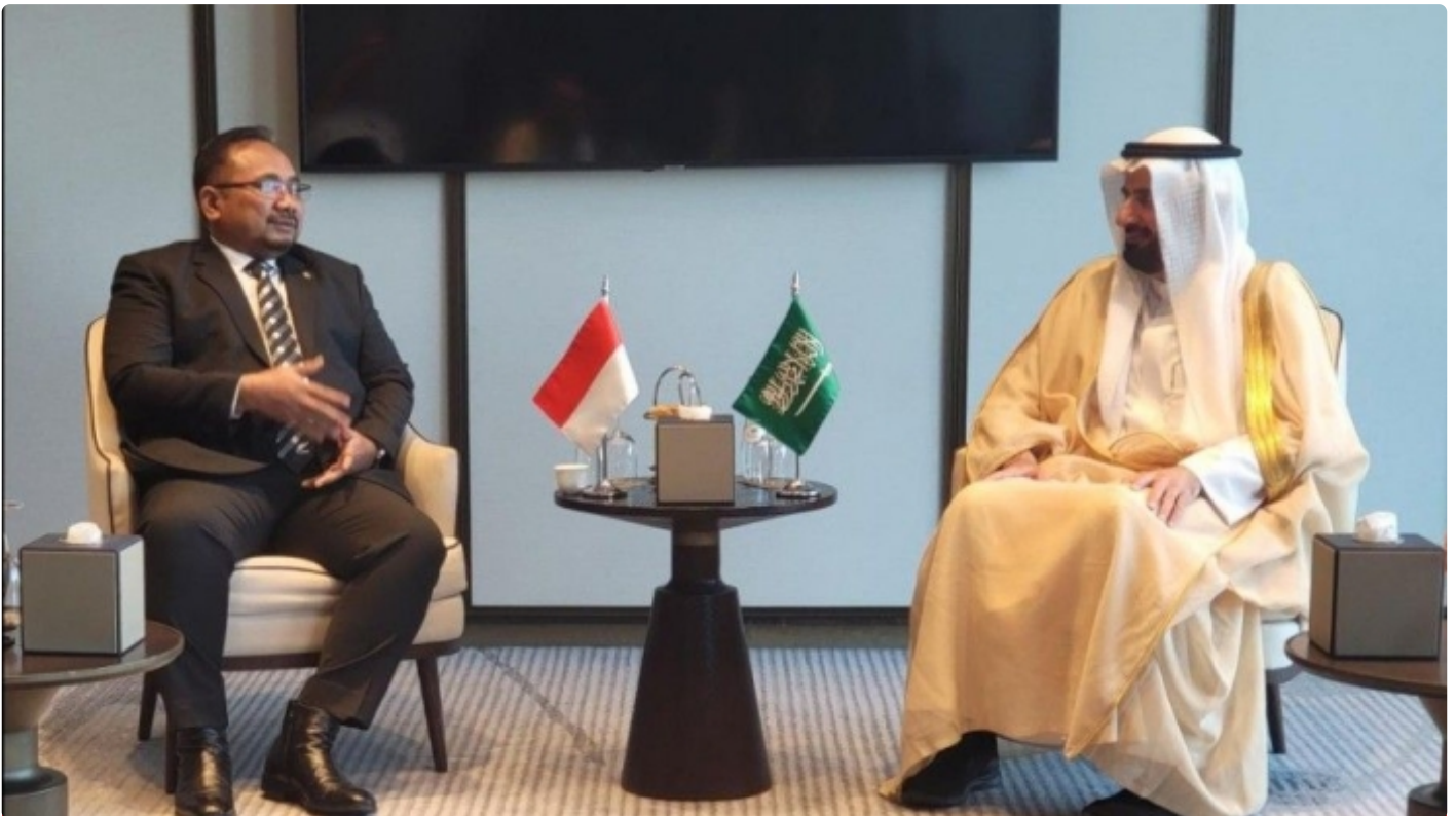
Menag Yaqut bertemu Menteri Haji Arab Saudi Tawfiq F. Al Rabiah, di Jeddah.

JAKARTA - Indonesia dan Pemerintah Kerajaan Arab Saudi telah menandatangani kesepakatan penyelenggaraan ibadah haji 1444 H/2023 M. Kesepakatan tersebut ditandatangani hari ini oleh Menag Yaqut Cholil Qoumas bersama Menteri Haji dan Umrah Arab Saudi Tawfiq F Al Rabiah di Jeddah.